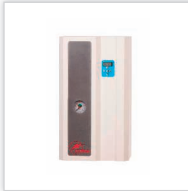
ELTERM, seria SilverLine, elektryczny kocioł centralnego ogrzewania „Rotmistrz”. Idealny jako alternatywny, współpracuje z każdym innym typem kotła c.o., może pracować w układzie c.o. otwartym lub zamkniętym, zabudowana pompa c.o. i armatura hydrauliczna. Moce [kW]: 4-24. Waga [kg]: 16. Wymiary (wys./szer./gł.) [cm]: 53/30/19. Cena katalogowa netto [zł]: od 2115.