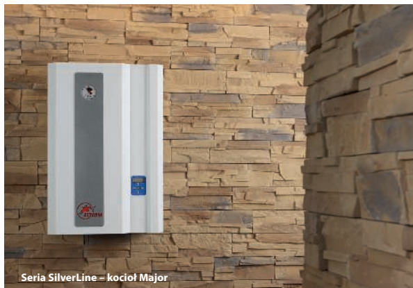
Seria SilverLine – kocioł Major

INSTALACJE GRZEWcze / KOTŁY ELEKTRYCZNE / ARMATURA HYDRAULICZNA