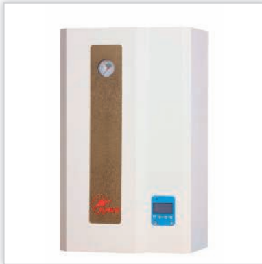
ELTERM, seria GoldLine, elektryczny kocioł centralnego ogrzewania „Pułkownik”. Do pracy samodzielnej, zabudowane naczynie przeponowe c.o. 8 l, pompa c.o. oraz armatura hydrauliczna; sterowanie pogodowe, wyświetlacz LCD; wbudowane programowanie tygodniowe. Moce [kW]: 4-24. Waga [kg]: 25. Wymiary (wys./szer./gł.) [cm]: 68/41/27. Cena katalogowa netto [zł]: od 2700.