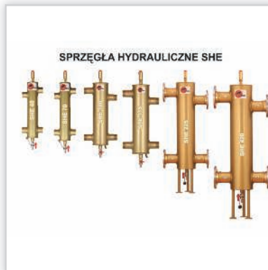
ELTERM, sprzęgła hydrauliczne nieocieplane. Do 30% dłuższa żywotność kotła dzięki skutecznej ochronie przed niską temp. wody powrotnej. Zwiększenie komfortu użytkownika dzięki wykorzystaniu odmulania oraz odpowietrzania układu. Do 30% dłuższa żywotność pomp za sprawą wzajemnego niezakłócenia pracy. 100% kontrola ciśnieniowa. Moce [kW]: 40-750. Przyłącza: od 1" do 5". Cena katalogowa netto [zł]: od 310.