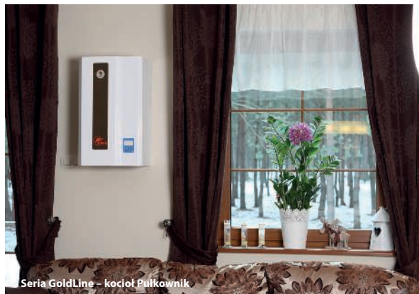
Seria GoldLine – kocioł Pułkownik