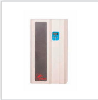
ELTERM, seria SilverLine, elektryczny kocioł centralnego ogrzewania „Wachmistrz”. Idealny jako alternatywny, współpracuje z każdym innym typem kotła c.o., może pracować w układzie c.o. otwartym lub zamkniętym. Moce [kW]: 4-24. Waga [kg]: 13. Wymiary (wys./szer./gł.) [cm]: 53/30/19. Cena katalogowa netto [zł]: od 1875.