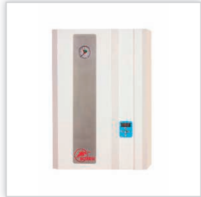
ELTERM, seria SilverLine, elektryczny kocioł centralnego ogrzewania „Major”. Do pracy samodzielnej lub jako alternatywny, zabudowane naczynie przeponowe c.o. 8 l, zabudowana pompa c.o. i armatura hydrauliczna, najbardziej popularny model. Moce [kW]: 4-24. Waga [kg]: 22. Wymiary (wys./szer./gł.) [cm]: 60/41/26. Cena katalogowa netto [zł]: od 2350.