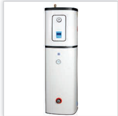
ELTERM, seria GoldLine, elektryczny kocioł centralnego ogrzewania „Marszałek”. Wolnostojący kocioł dwufunkcyjny z zabudowanym zasobnikiem 100 l, naczyniem przeponowym c.o. 8 l, 2 pompami c.o./c.w.u. oraz armaturą hydrauliczną; sterowanie pogodowe, wyświetlacz LCD; wbudowane programowanie tygodniowe oraz programowanie c.w.u. Moce [kW]: 4-24. Waga [kg]: 80. Wymiary (wys./szer./gł.) [cm]: 156/46/46. Cena katalogowa netto [zł]: od 4990.